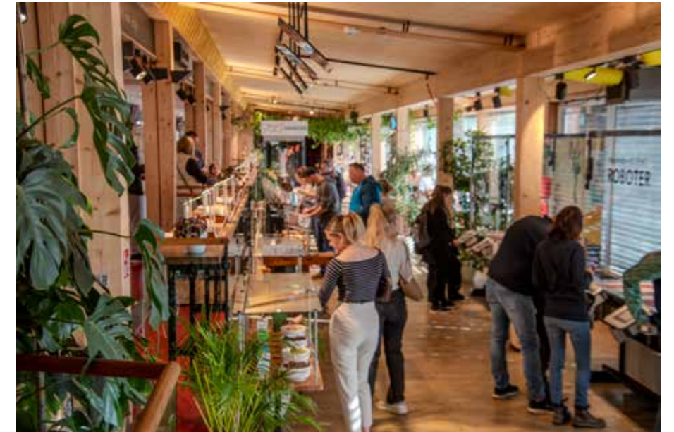
Zotter Schokoladen

Zur fünften Jahreszeit ist im Thermen- & Vulkanland der Advent geworden. Neben den großen Ausstellungen im Wasserschloss Burgau oder auf Schloss Kornberg und den vielen Adventmärkten wird in der besinnlichen Vorweihnachtszeit Tradition großgeschrieben. In Gossendorf wartet ein Krippenweg mit über 60 Krippen darauf, mit oder ohne Fackel erkundet zu werden, während man in Gnas, Bad Gleichenberg, Feldbach oder Hatzendorf Nachtwächter oder Hirten begleiten kann, wenn sie die Kerzen bei Einbruch der Dunkelheit in ihren Gemeinden entzünden.