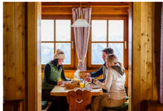
Einkehr Loserhütte

An dieser Stelle möchten wir als Tourismusverband Ausseerland Salzkammergut uns herzlichst bei euch, liebe Gastgeber und Gastgeberinnen, für Euren Einsatz bedanken. Wir wünschen euch allen ein frohes Weihnachtsfest, einen gesunden Start ins Jahr 2025 und freuen uns auf eine weiterhin tolle Zusammenarbeit!