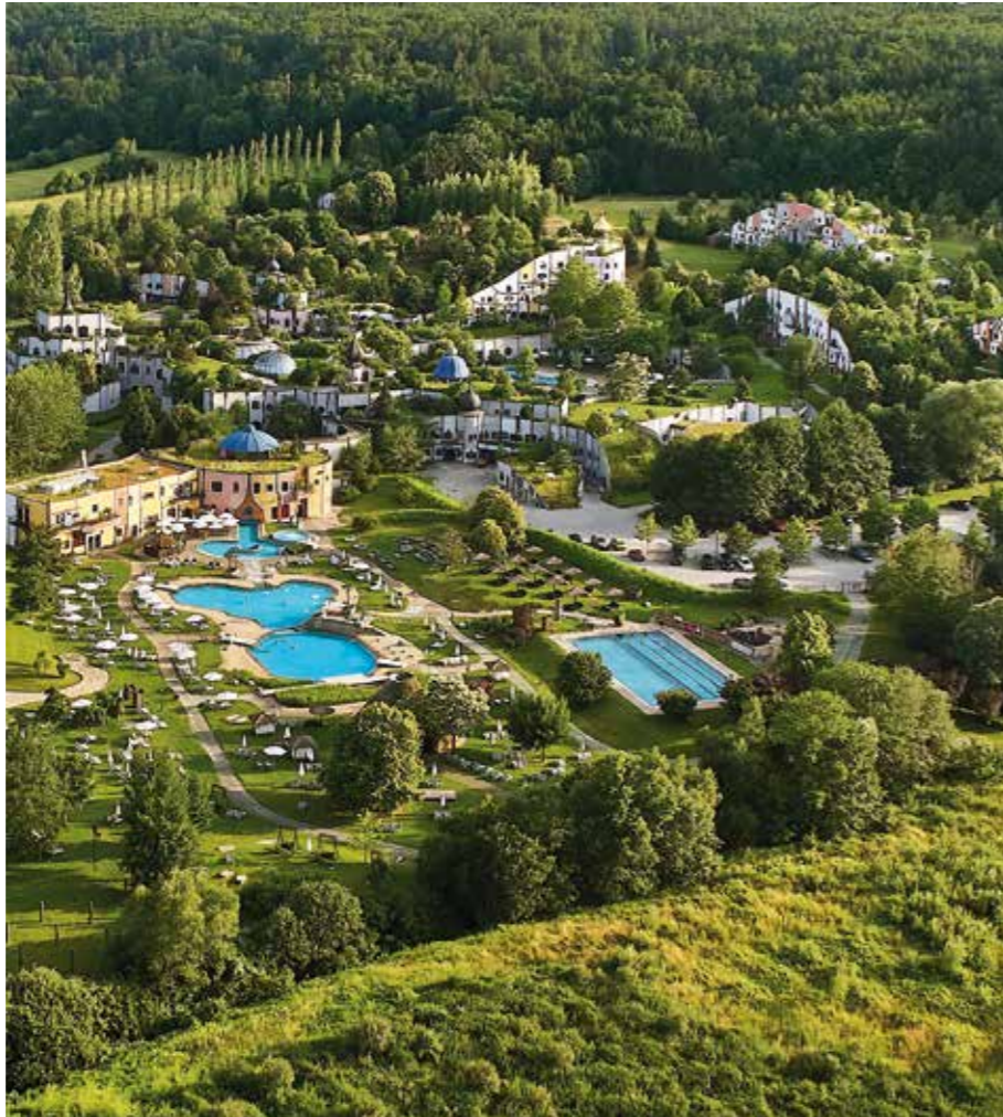
Rogner Bad Blumau © Hundertwasser Architekturprojekt

„Zu schön, um nicht da zu sein“ – der Slogan des Thermen- & Vulkanlandes hält, was er verspricht. Erholung im wohlig-warmen Thermalwasser, Top-Kulinarik vom Buschenschank bis zum Haubenlokal, Genussradwege, Weinwandern oder Golfen das ganze Jahr über, hier ist immer was los. Während in vielen Teilen von Österreich noch eine dicke Schneedecke liegt, eröffnen hier schon die Golfplätze und die Bewegungsfreude der Menschen, laufend oder radelnd, verlegt sich in die Natur.